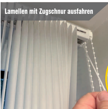
Lamellen mit Zugschnur ausfahren