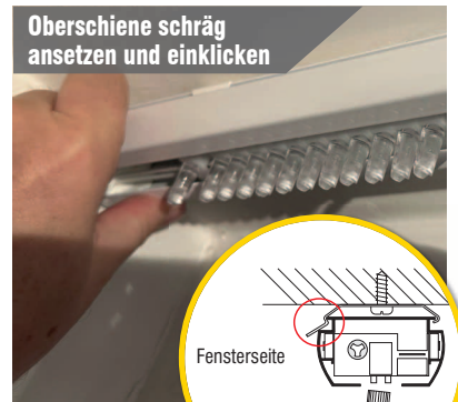
Oberschiene schräg ansetzen und einklicken

Führen Sie anschließend die Bohrungen durch und befestigen Sie die Clipse.