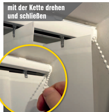
mit der Kette drehen und schließen

Sollte unten ein ungleichmäßiges Höhenbild der Lamellen zu sehen sein, sind diese oben nicht richtig eingerastet!