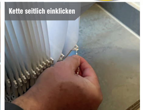
Kette seitlich einklicken